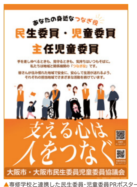
▲専修学校と連携した民生委員・児童委員PRポスター

市内各区民生委員児童委員協議会においても、のぼり旗や懸垂幕の掲出、PRグッズの配布、ポスター掲示等の啓発活動をおこなっています。