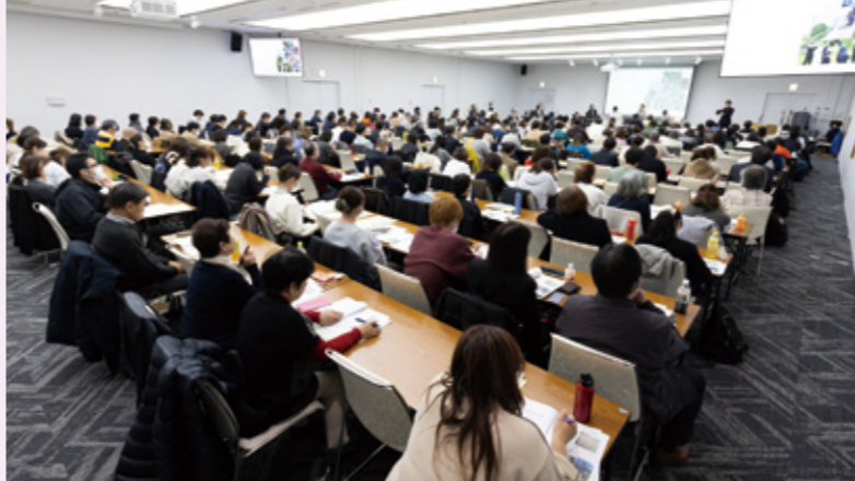
▲会場全体で意見交換をおこないました

市社協では、3月7日にたかつガーデンで「ゆるふわでええやん！ゆるふわでいいんだよって言ってくれる第三の大人の必要性」と題して地域福祉シンポジウムを開催しました。今回は、大阪市地域福祉施設協議会(以下、