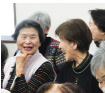
アットホームな雰囲気、終始楽しく過ごしました

うたくらぶに参加しています。入院した時も、うたくらぶに参加したいから、退院できるように頑張りました」などの声がありました。