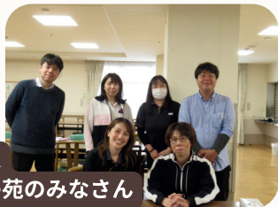
チーム おがわ苑のみなさん