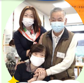
1番のファンなのよ！とはじける笑顔