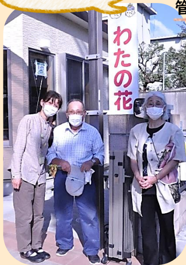
手作りの看板とあたたかい笑顔が迎えてくれます♥