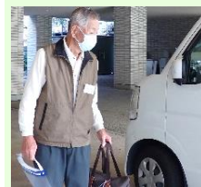
送迎車が到着！すぐにお出迎え

活動は恩返しのため。何事も持ちつ持たれつですから。お手伝いすることで逆に元気をもらえます。コロナ禍で休んだ後、活動を再開したら、利用者さんが喜んでくれてね。それは嬉しかったですよ。