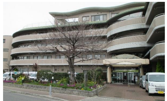
社会福祉法人 大阪自彊館

今回は、社会福祉法人 大阪自彊館 ベラミ(淡路福祉サービスステーション)で活動中の6人の方々を紹介したいと思います。